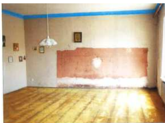
Widok fragmentu pokoju.