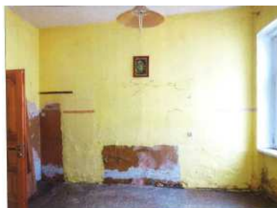
Widok fragmentu pokoju.