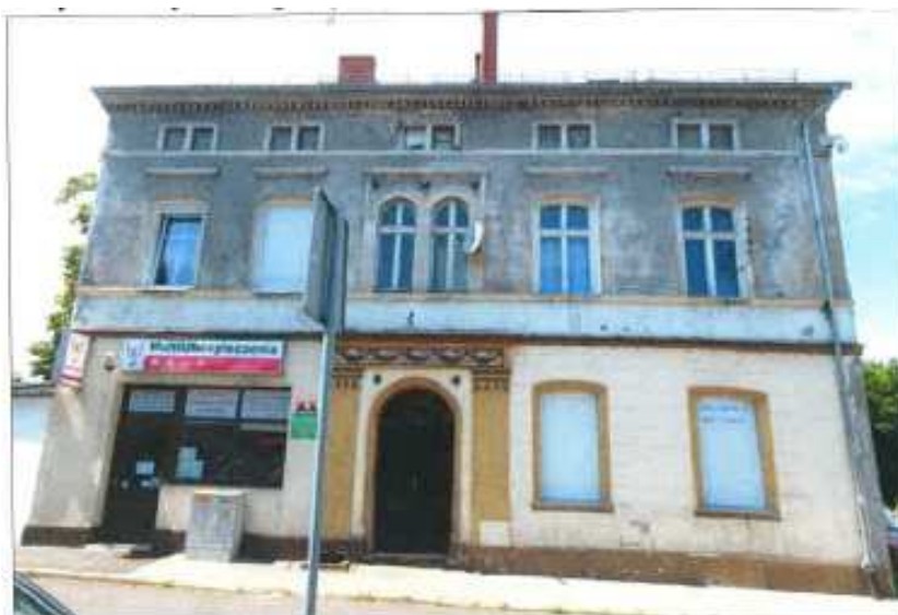
Widok elewacji frontowej – Plac Strażacki nr 5.

na sprzedaż lokalu mieszkalnego Nr 1, znajdującego się w budynku położonym w Lubaniu przy Placu Strażackim 5 wraz z udziałem we współwłasności nieruchomości gruntowej (działka nr 5, AM 4, Obręb III o powierzchni 164 m 2 , JG1L/00020876/7)