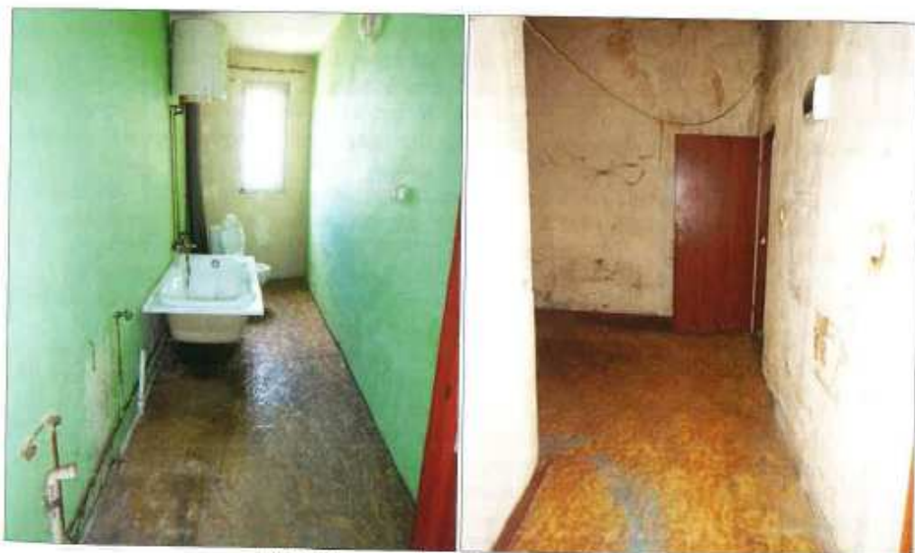
Widok fragmentu łazienki z wc i przedpokoju.