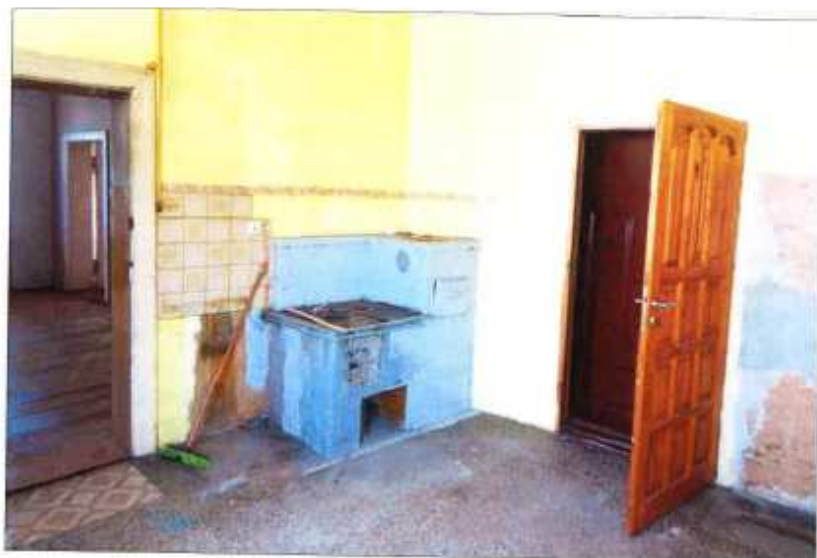
Widok fragmentu kuchni.